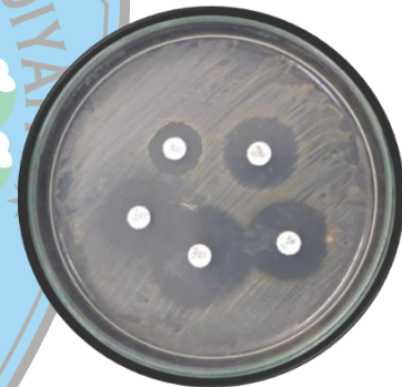
Gambar 1. Uji sensitivitas strain S.aureus MRSA terhadap 5 macam

Hasil uji sensitivitas 3 strain S.aureus menunjukkan SP1, SP2 dan SP3 sensitif terhadap antibiotik Sulphamethaxazole , Fosfomycin , Vancomicin dan resisten terhadap antibiotik Oxacillin dan Gentamicin . Hasil uji sensitivitas dapat dilihat pada gambar 1.