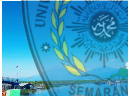
Gambar 2.2 Pemandangan alam Rawa Pening

Daya tarik yang ditawarkan rawa pening adalah wisata Tirta: dengan perahu tradisional, penghasil enceng gondok, area pemancingan alam, obyek fotografi yang mempesona, serta sumber mata pencaharian nelayan, hal ini terlihat dari kegiatan sehari-hari masyarakat setempat yang sebagian besar berprofesi sebagai nelayan memanfaatkan rawa Pening sebagai tempat untuk mencari ikan dengan cara memancing atau membuat keramba. (Sutono,Ari, dkk 2017:1). Berikut dokumentasi tentang Rawa Pening berdasarkan kegiatan PHBD 2017, dimana peneliti merupakan anggota PHBD, dapat dilihat pada gambar 2.2 dan gambar 2.3: