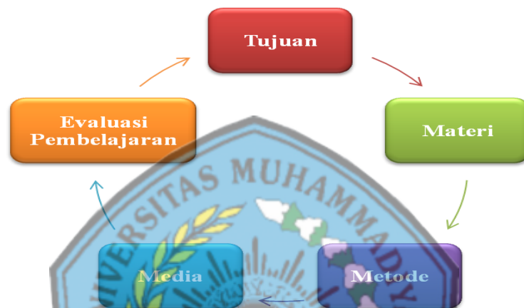
Gambar 2.1 Hubungan Antar Komponen dalam Pembelajaran (Riyana, 2013: 3)

yang lain. sedangkan ciri-ciri lainnya dari pembelajaran itu sendiri. Dimana didalam pembelajaran akan terdapat komponen-komponen sebagai berikut: tujuan, materi/ bahan ajar, metode dan media, evaluasi, siswa, dan guru/ pendidik (Riyana, 2013: 3). Berikut gambar 2.1 hubungan antar komponen dalam pembelajaran: