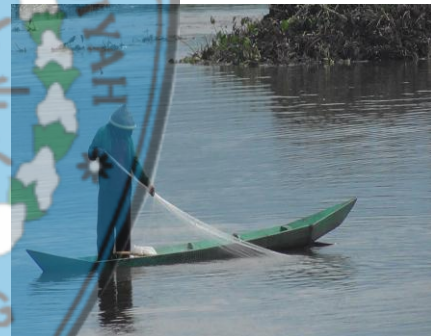
Gambar 2.3 Nelayan sedang memancing menggunakan jaring ikan di Rawa Pening (Sumber: PHBD Unimus 2017)