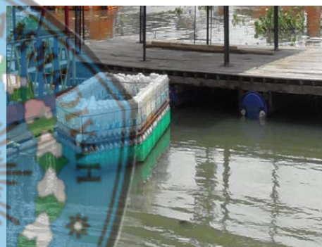
Gambar 2.5 Perahu botol salah satu perilaku pemanfaatan botol bekas