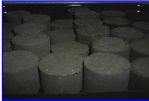
Gambar 6. Briket Bioarang