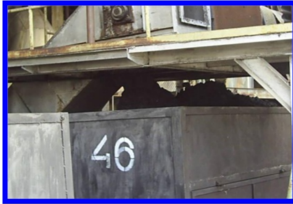
Gambar 4. Abu Ketel Ditampung Menggunakan Troli

ketel tersebut dibawa ke tempat pembuangan yang lokasinya jauh dari pemukiman penduduk.