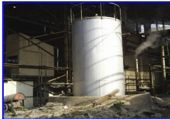
Gambar 2. Delay Tank Tempat Supply Residu

Pabrik gula membutuhkan bahan bakar untuk menjalankan proses produksinya. Pada pabrik gula (khususnya PG. Trangkil), menggunakan dua macam bahan bakar, yaitu bahan bakar cair dan bahan bakar padat. Bahan bakar cair yang digunakan adalah residu. Minyak residu adalah hasil pengolahan minyak bumi dengan kualitas di bawah solar dan di atas aspal.