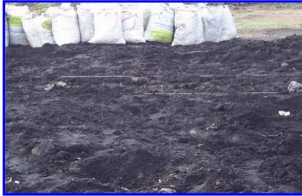
Gambar 1. Limbah Sisa Pembakaran Bahan Bakar Pabrik Gula

Berdasarkan terjadinya bahan bakar dapat dibedakan menjadi dua golongan yaitu bahan bakar alami dan bahan bakar buatan.