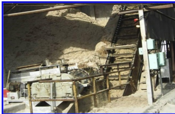
Gambar 3. Ampas Hasil Penggilingan Tebu

Setiap proses pembakaran, pasti ada sisa hasil pembakaran. Begitu juga pada proses pembakaran bahan bakar pada pabrik gula. Sisa pembakaran tersebut berupa panas yang terbuang akibat rugi-rugi, karena tidak seluruhnya energi kalor yang digunakan dapat dimanfaatkan semua untuk proses pembakaran. Sisa pembakaran yang lain adalah fly ash dan bottom ash . Untuk menangani bottom ash , digunakan conveyor dengan sistem terendam air agar abu yang dihasilkan tidak berterbangan. Untuk menangani fly ash digunakan sistem cyclone agar partikel-partikel yang berat jatuh ke bawah untuk mengurangi polusi lingkungan.