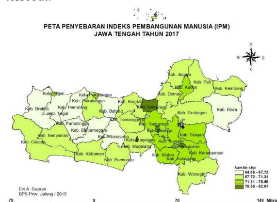
Gambar 1 Penyebaran Indeks Pembangunan Manusia (IPM) Jawa Tengah

Eksplorasi data yang dilakukan pada penelitian ini untuk mengetahui karakteristik dari data secara umum dengan menggunakan peta tematik, dimana semakin pekatnya warna pada peta maka semakin tinggi nilai IPM pada wilayah tersebut.