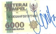
Leonita Reza Palevi