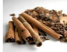
Gambar 3.1 Kulit Kayu Manis 18

Ordo : Policarpicae Famili : Lauraceae Genus : Cinnamomum Spesies : Cinnamomum burmannii