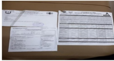
Gambar 3 Form Premarital Yang