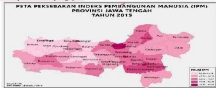
Gambar 1. IPM Kabupaten/Kota di Provinsi Jawa Tengah

Penyebaran IPM dijelaskan dalam gambar sebagai berikut :