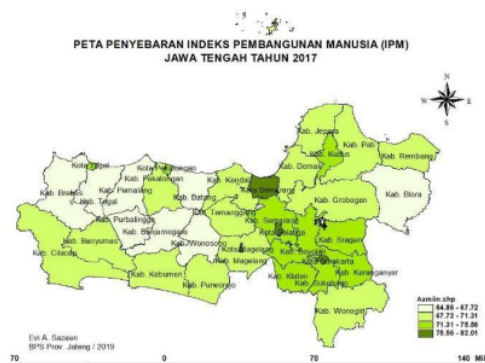
Gambar 1 Penyebaran Indeks Pembangunan Manusia (IPM) Jawa Tengah

Eksplorasi data yang dilakukan pada penelitian ini untuk mengetahui karakteristik dari data secara umum dengan menggunakan peta tematik, dimana semakin pekatnya warna pada peta maka semakin tinggi nilai IPM pada wilayah tersebut.