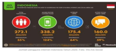
Gambar 1. Jumlah Pengguna Internet di Indonesia Tahun 2020

Menonton merupakan salah satu hiburan yang sangat digemari oleh masyarakat. Di zaman digital yang serba cepat dan serba ada, banyak masyarakat yang beralih dari menonton televisi ke menonton di layanan digital streaming . Pesatnya perkembangan internet di dunia, menghadirkan banyak usaha dan jasa yang mulai bergerak dari offline ke online , salah satunya adalah layanan media streaming . Menurut We Are Social 64% penduduk Indonesia telah terkoneksi dengan internet dari total populasi di Indonesia yang mencapai 272 juta jiwa. Semakin pesatnya pengguna internet, semakin berkembang pula pengguna media sosial. Hal ini dibuktikan dengan 59% atau 160 juta penduduk Indonesia aktif menggunakan media sosial.