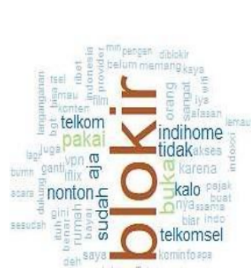
Gambar 4. Word Cloud Sentimen