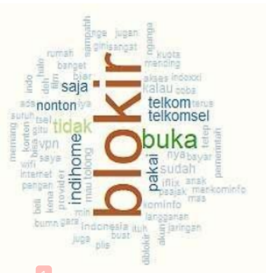
Gambar 3. Word Cloud Sentimen Positif Negatif