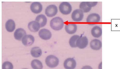
Gambar 1. Basofilik stipling dengan pengecatan Giemsa X= contoh sel basofilik stipling