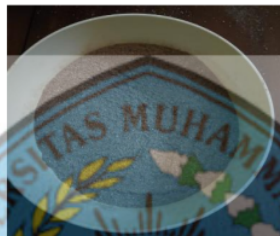
Gambar 3: Tepung Buah Kawista