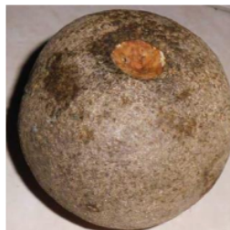
Gambar 1: Buah Kawista

Sebelum melakukan tahap penelitian, buah kawista dibuat menjadi tepung dengan cara buah kawista dibuka lalu diambil isi didalamnya yang berwarna merah kecoklatan, kemudian di ratakan diatas loyang, setelah itu dilakukan proses pengeringan dengan cabynet drier dengan suhu \pm 60^{\circ}\text{C} selama 24 jam, pada tahap selanjutnya dilakukan proses penghalusan yakni dengan blender dan diayak dengan ayakan 80 mesh .