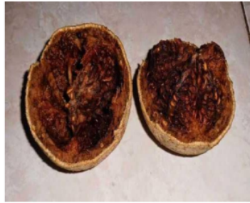
Gambar 2: Daging Buah Kawista