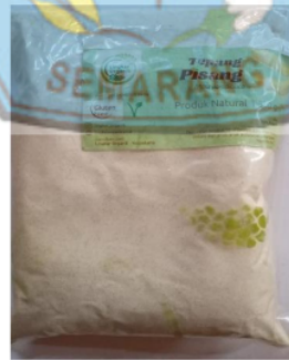
Gambar 4: Tepung Pisang Raja

Pembuatan makanan tambahan balita dengan bahan-bahan tepung terigu 200 gram, tepung kawista 100 gram, tepung pisang raja 50 gram, tepung maizena 30 gram, margarine 50 gram, gula halus 50 gram, tepung susu skim 15 gram, dan kuning telur 2 butir 60 gram. Sebelumnya, memanaskan terlebih dahulu oven pada suhu \pm 150^{\circ}\text{C} , lalu memixer margarin; kuning telur; dan gula halus, lalu masukkan tepung terigu, dan tepung maizena ke dalam adonan sambil di mixer dengan kecepatan rendah, setelah itu ditambahkan tepung kawista dan