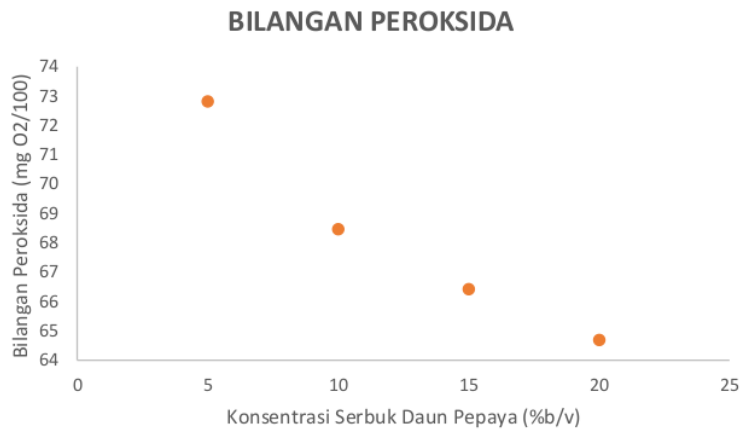
Gambar 1. Konsentrasi serbuk daun pepaya vs Bilangan peroksida

ditambah dengan serbuk daun pepaya daun pepaya selanjutnya disaring kemudian ditetapkan bilangan peroksidanya dan didapatkan hasil sebagai berikut: 1 konsentrasi 5 %b/v; 10 %b/v; 15 %b/v dan 20 %b/v dan diaduk menggunakan shaker selama satu hari. Minyak jelantah yang telah direndam ditambah dengan serbuk