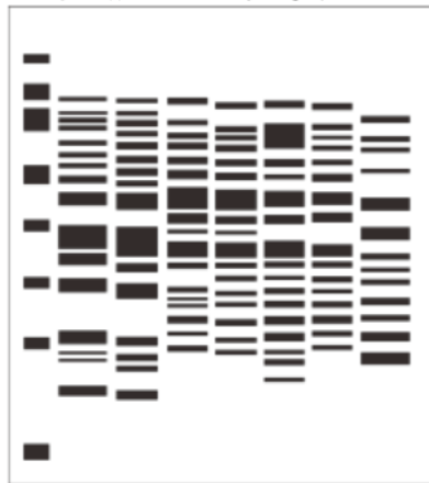
Gambar 2 : Visualisasi representasi pita protein bakteri asam laktat isolat ASI