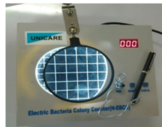
Gb 3. Kotak daerah perhitungan pada colony counter

Sebelum dilakukan uji statistik untuk mengetahui efektivitas berkumur larutan garam terhadap jumlah koloni streptococcus mutans dalam saliva, uji normalitas data perlu dilakukan. Suatu data dikatakan berdistribusi normal apabila pada uji normalitas