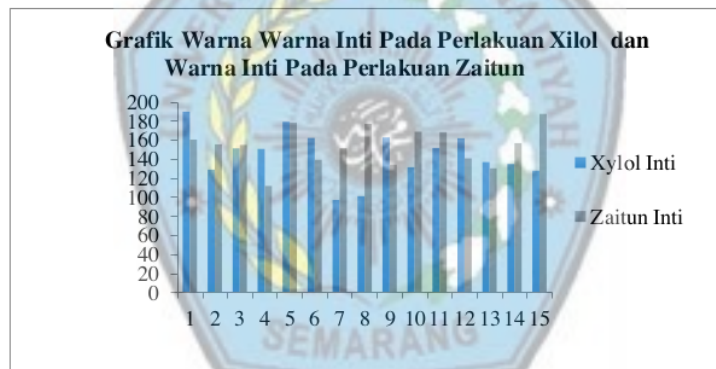
Gambar 2: Grafik warna Inti.

Berdasarkan Gambar 2 diketahui hasil pengukuran warna xilol inti dan warna zaitun inti, kelompok minyak zaitun lebih tinggi dibandingkan dengan hasil pengukuran warna inti kelompok xilol.