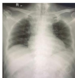
Gambar 2 Hasil pemeriksaan thorax