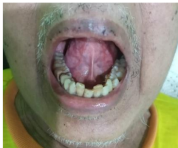
Gambar 1 Kondisi klinis rongga mulut

Pasien juga dirujuk ke dokter spesialis penyakit dalam dan dokter gigi spesialis bedah mulut untuk dilakukan pemeriksaan dan perawatan lebih lanjut.