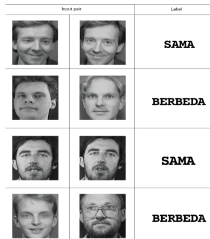
Gambar 1. Labeling data

Dari keseluruhan data yang ada kami akan mengambil beberapa gambar yang dimana kami mengambil sample dari gambar yang sama dan gambar yang berbeda, kemudian kami akan memberikan label pada masing-masing gambar seperti pada contoh dibawah agar dapat diolah dan dimasukan kedalam Convolutional Neural Network (CNN) .