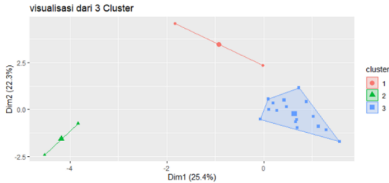
Gambar 2. Output K-means clustering

Dari gambar 2 di atas didapatkan hasil clustering menggunakan cluster plot , diketahui bahwa cluster 1 berwarna merah, cluster 2 berwarna hijau, dan cluster 3 berwarna biru, setiap warna memiliki karakteristik yang berbeda-beda.