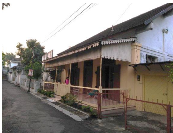
Gambar 9. Bentuk Atap Bangunan

Atapnya genteng, dengan teras di depan rumah untuk menghindari hujan dan sinar matahari berlebihan. Selain itu tiang-tiang pada selasar untuk menopang atap digunakan pada area pintu masuk seperti pada rumah-rumah Belanda.