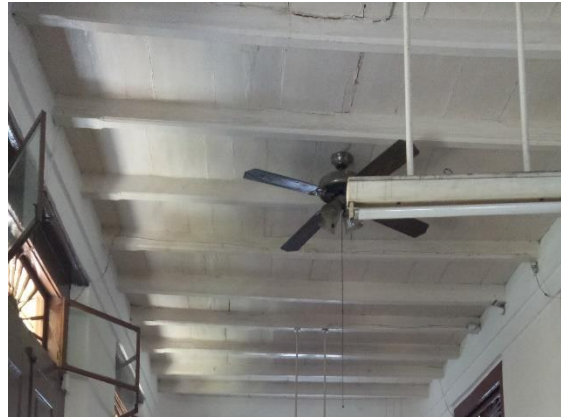
Gambar 6. Plafond Bangunan

Plafond menggunakan papan kayu dengan rangka penyangga plafond yang juga terbuat dari kayu juga.