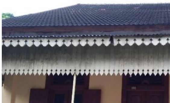
Gambar 8. Ornamen pada List Plank Bangunan