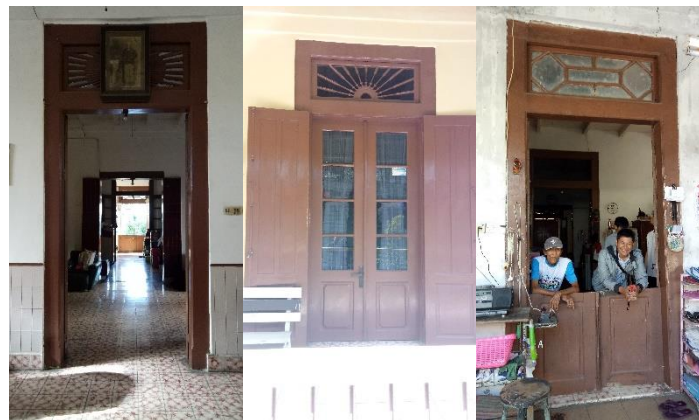
Gambar 7. Ornamen pada Pintu dan Jendela

Penggunaan ornamen pada bangunan berfungsi sebagai unsur pembentuk estetika. Ornamen pada bangunan ini terdapat pada ornamen ventilasi di atas pintu dan jendela serta ornamen pada daun pintu dan jendela. Ornamen ini memiliki motif sulur gunung dan pola geometris.