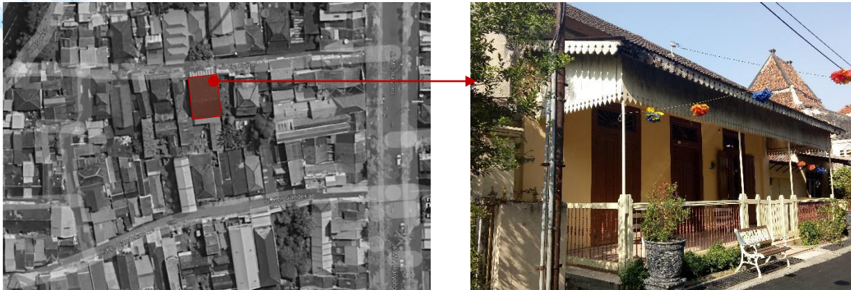
Gambar 2. Lokasi Rumah Tinggal Bapak A. T. NG. Moeljo