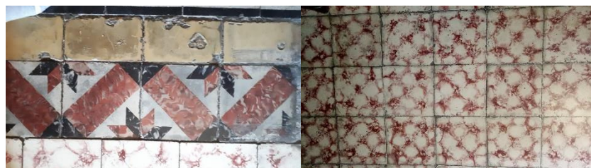
Gambar 5. Lantai Bangunan

Material yang digunakan sebagai penutup Lantai Rumah Pak A. T. NG. Moeljo adalah ubin tegel, ada 2 pola lantai yang dipakai yaitu pada area pinggir lantai dan pola area tengah. Pola ini diterapkan pada seluruh ruang di rumah ini.