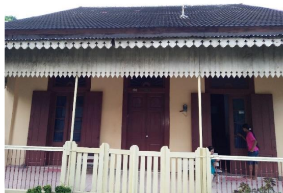
Gambar 3. Tampak Bangunan Rumah Tinggal

Bentuk dan tampilan bangunannya merupakan perwujudan arsitektur Indis, terutama gaya atap pelana dengan atap kantilever panjang. Bentuk pintu yang simetris pada bagian depan bangunan yang juga merupakan ciri dari arsitektur Indis.