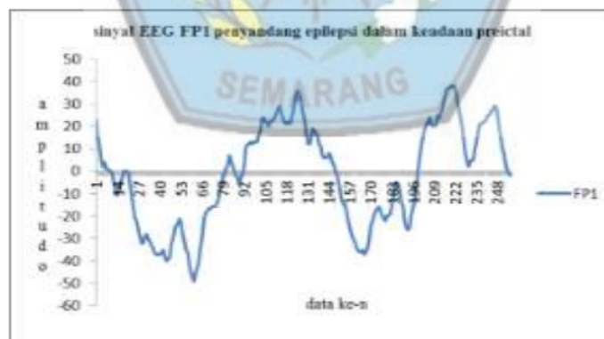
Gambar 1. Sinyal EEG FP1 penyandang epilepsi dalam keadaan akan serangan

Dalam penelitian ini menggunakan matlab 2014 dengan hasil pada gambar 1 menunjukkan sinyal penyandang epilepsi dalam keadaan preictal (sebelum serangan). Amplitudo menunjukkan dibawah 100\mu V pada sinyal FP1, seperti pada sinyal EEG orang normal yang ditunjukkan pada gambar 3. Pada gambar 2 menunjukkan sinyal EEG epilepsi dalam keadaan serangan