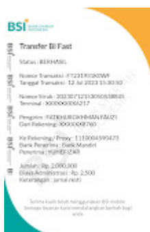
WhatsApp Image 2023-07-12 at 3.31.01 PM (1).jpeg 109K