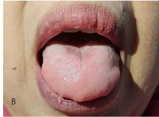
Gambar 3. Gambaran klinis kunjungan ketiga. (A) Angular cheilitis pada kedua sudut bibir sudah sembuh. (B) Atrofi papilla lidah mengalami perbaikan.

Transportasi oksigen yang cukup ke seluruh jaringan, termasuk mukosa mulut, sangat penting untuk kesehatan mulut yang baik. Oksigen diangkut ke jaringan oleh hemoglobin, yang merupakan kombinasi hemokromatosis dan protein globin. Kekurangan zat besi dapat menyebabkan infeksi mulut karena kekurangan oksigen. Diagnosis anemia ditegakkan melalui pemeriksaan fisik, tanda, gejala, dan temuan laboratorium hematologi. Kadar hemoglobin (Hb) dapat dievaluasi dalam pemeriksaan darah rutin. Anemia defisiensi besi adalah manifestasi paling umum dari kadar besi serum yang rendah, dan dapat bermanifestasi di rongga mulut dengan angular cheilitis, glositis, atrofi mukosa mulut menyeluruh, infeksi Candida , dan recurrent aphthous stomatitis . [5,6]