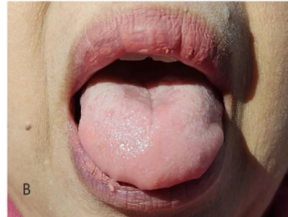
Gambar 3. Gambaran klinis kunjungan ketiga. (A) Angular cheilitis pada kedua sudut bibir sudah sembuh. (B) Atrofi papilla lidah mengalami perbaikan.

Transportasi oksigen yang cukup ke seluruh jaringan, termasuk mukosa mulut, sangat penting untuk kesehatan mulut yang baik. Oksigen diangkut ke jaringan oleh hemoglobin, yang merupakan kombinasi hemokromatosis dan protein globin. Kekurangan zat besi dapat menyebabkan infeksi mulut karena kekurangan oksigen. Diagnosis anemia ditegakkan melalui pemeriksaan fisik, tanda, gejala, dan temuan laboratorium hematologi. Kadar hemoglobin (Hb) dapat dievaluasi dalam pemeriksaan darah rutin. Anemia defisiensi besi adalah manifestasi paling umum dari kadar besi serum yang rendah, dan dapat bermanifestasi di rongga mulut dengan angular cheilitis, glositis, atrofi mukosa mulut menyeluruh, infeksi Candida , dan recurrent aphthous stomatitis . [5,6]