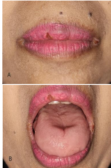
Gambar 2. Gambaran klinis kunjungan kedua. (A) Angular cheilitis mengalami perbaikan. (B) Kandidiasis pseudomembran pada dorsum lidah sudah sembuh.

Kunjungan kedua setelah satu minggu terapi, tampak lesi angular cheilitis mengalami perbaikan (Gambar 2A) dan kandidiasis pseudomembran sudah sembuh. Obat digunakan rutin oleh pasien. Dilakukan KIE untuk melanjutkan pemakaian obat dan kontrol 1 minggu kemudian.