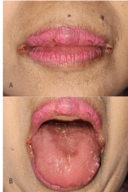
Gambar 1. Gambaran klinis kunjungan pertama. (A) Angular cheilitis pada sudut bibir bilateral. (B) Kandidiasis pseudomembran dan atrofi papila pada dorsum lidah.

Pemeriksaan ekstraoral tampak konjungtiva anemis dan lesi fisura eritema disertai krusta, berukuran 4 mm pada sudut bibir bilateral (Gambar 1A). Pemeriksaan intraoral tampak atrofi papila disertai plak putih kekuningan menyebar yang dapat discrap dan meninggalkan eritema pada dorsum lidah (Gambar 1B).