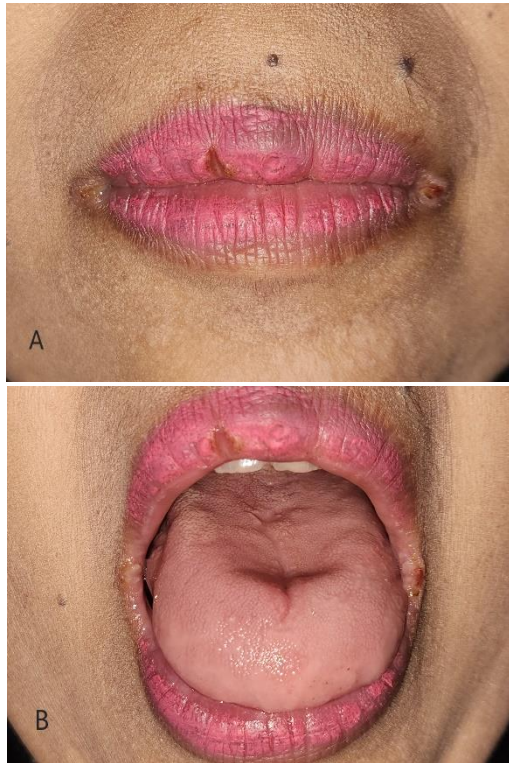
Gambar 2. Gambaran klinis kunjungan kedua. (A) Angular cheilitis mengalami perbaikan. (B) Kandidiasis pseudomembran pada dorsum lidah sudah sembuh.

Kunjungan kedua setelah satu minggu terapi, tampak lesi angular cheilitis mengalami perbaikan (Gambar 2A) dan kandidiasis pseudomembran sudah sembuh. Obat digunakan rutin oleh pasien. Dilakukan KIE untuk melanjutkan pemakaian obat dan kontrol 1 minggu kemudian.