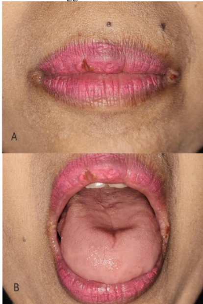
Gambar 2. Gambaran klinis kunjungan kedua. (A) Angular cheilitis mengalami perbaikan. (B) Kandidiasis pseudomembran pada dorsum lidah sudah sembuh.

sudah sembuh. Obat digunakan rutin oleh pasien. Dilakukan KIE untuk melanjutkan pemakaian obat dan kontrol 1 minggu kemudian.