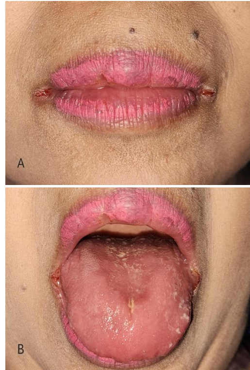
Gambar 1. Gambaran klinis kunjungan pertama. (A) Angular cheilitis pada sudut bibir bilateral. (B) Kandidiasis pseudomembran dan atrofi papila pada dorsum lidah.

Pemeriksaan ekstraoral tampak konjungtiva anemis dan lesi fisura eritema disertai krusta, berukuran 4 mm pada sudut bibir bilateral (Gambar 1A). Pemeriksaan intraoral tampak atrofi papila disertai plak putih kekuningan menyebar yang dapat discrap dan meninggalkan eritema pada dorsum lidah (Gambar 1B).