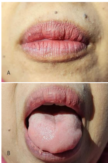
Gambar 3. Gambaran klinis kunjungan ketiga. (A) Angular cheilitis pada kedua sudut bibir sudah sembuh. (B) Atrofi papilla lidah mengalami perbaikan.

Pemeriksaan ekstraoral pada kunjungan ketiga, 2 minggu terapi, tampak lesi angular cheilitis pada kedua sudut mulut sudah sembuh dan tidak ada keluhan apapun. Pasien dikonsultasikan ke dokter spesialis penyakit dalam untuk terapi anemia lebih lanjut.