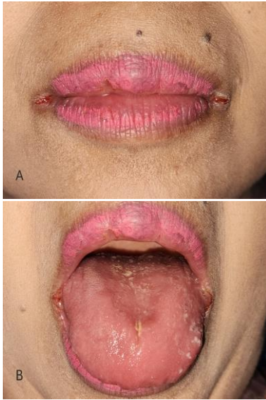
Gambar 1. Gambaran klinis kunjungan pertama. (A) Angular cheilitis pada sudut bibir bilateral. (B) Kandidiasis pseudomembran dan atrofi papila pada dorsum lidah.

Pemeriksaan ekstraoral tampak konjungtiva anemis dan lesi fisura eritema disertai krusta, berukuran 4 mm pada sudut bibir bilateral (Gambar 1A). Pemeriksaan intraoral tampak atrofi papila disertai plak putih kekuningan menyebar yang dapat discrap dan meninggalkan eritema pada dorsum lidah (Gambar 1B).